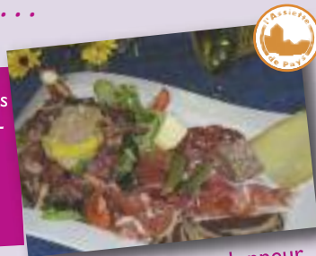
L'assiette La Randonneur

L'assiette Paulin L'assiette Randonneur et Rando Junior L'assiette Découverte L'assiette Canardière Avenue du Lac 64800 Baudreix Tél. 05 59 92 97 73 Site : www.lesokiri.net