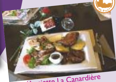
L'assiette La Canardière