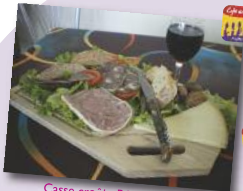
Casse croûte Bénéjacois