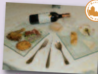
L'assiette La Jacquaire

Route des Grottes 64800 Lestelle Bétharram Tél. 05 59 71 94 87 Fax : 05 59 71 96 75 Site : www.hotel-levieuxlogis.com