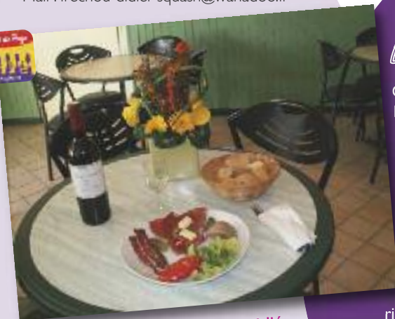
Casse-croûte de la Vallée de l'Ouzom