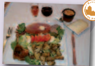
L'assiette La Pardiesienne

10, rue Capdebat 64800 Pardies Piétat Tél. 05 59 71 22 58 Site : www.hotel-restaurant-nay.com